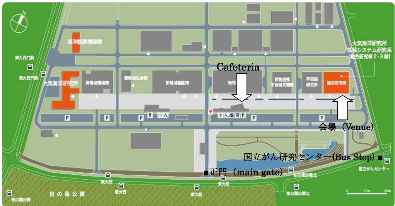
柏キャンパス (Kashiwa Campus)

http://www.aori.u-tokyo.ac.jp/access/index.html